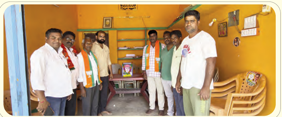
నస్సూర్ ప్రెస్ క్లబ్లో రక్తదానం చేయాలి