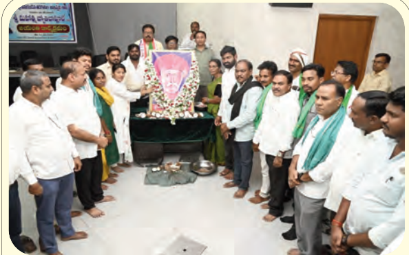
నివాళులు అర్పిస్తున్న జిల్లా పంచాయతీ అధికారి బక్షపతి