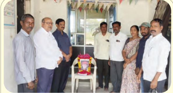
మహాత్మా జ్యోతిబాపూలే చిత్రపటానికి నివాళులర్పిస్తున్న అధికారులు