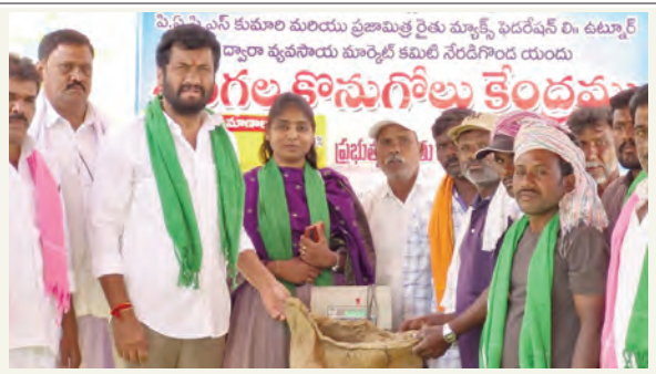
శనగల కొనుగోలు కేంద్రాన్ని ప్రారంభిస్తున్న బోధ ఎమ్మెల్యే అనిల్ జాదవ్