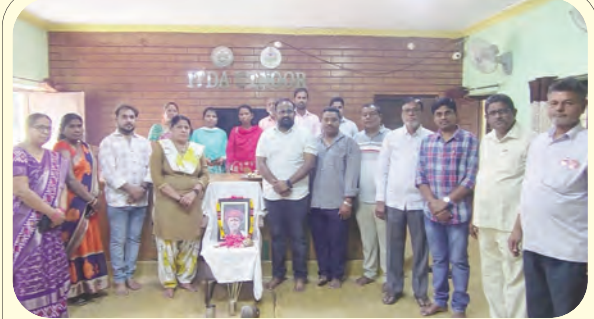
నివాళులు అర్పిస్తున్న ఐటీడీఏ అధికారులు