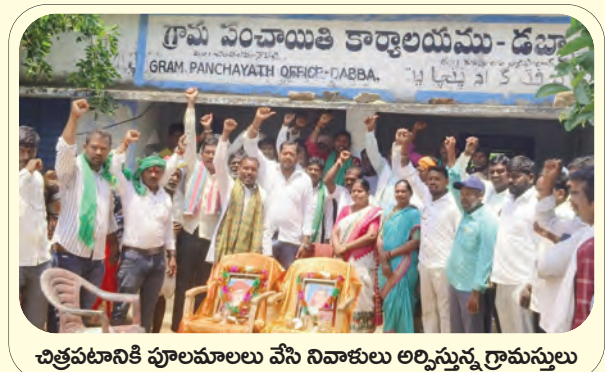
చిత్రపటానికి పూలమాలలు వేసి నివాళులు అర్పిస్తున్న గ్రామస్థులు