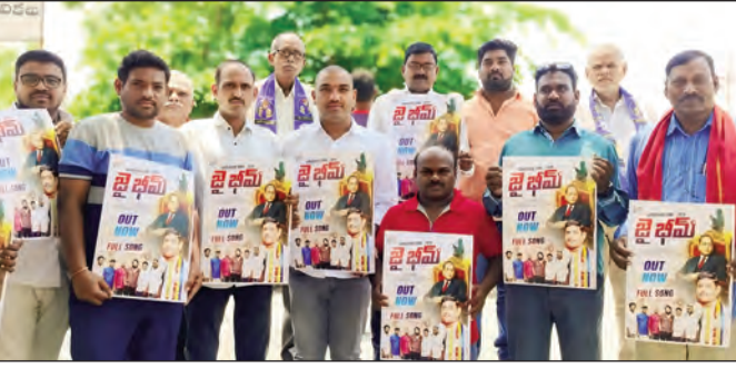
జై భీమ్ అంబేద్కర్ సాంగ్-2026 పోస్టర్ను ఆవిష్కరించారు