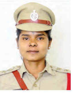
ఎన్ఐఐ పూజ హెచ్చరిక

సమాజానికి కీడు చేస్తున్న గుడుంబా, గంజాయి విక్రయాలను అరికట్టేందుకు కఠిన చర్యలు తీసుకుంటున్నట్లు సిరికొండ ఎన్ఐఐ పూజ తెలిపారు. యువత భవిష్యత్తును నాశనం చేస్తున్న ఇటువంటి ఆక్రమ వ్యాపారాల పట్ల ప్రజలు అప్రమత్తంగా ఉండాలని సూచించారు. ఎక్కడైనా గుడుంబా తయారీ లేదా గంజాయి రవాణా జరుగుతుంటే వెంటనే పోలీసులకు సమాచారం అందించాలని కోరారు. ఆక్రమ కార్యకలాపాల వివరాలను పోలీసుల అధికారిక వెబ్సైట్ నంబర్కు పంపవచ్చని, సమాచారం ఇచ్చిన వారి వివరాలను అత్యంత గోప్యంగా ఉంచుతామని భరోసా ఇచ్చారు. ఎవరూ భయపడకుండా ముందుకు వచ్చి పోలీసులకు సహకరించాలని, అసాంఘిక శక్తులపై ఉక్కుపాదం మోపేందుకు ప్రజల భాగస్వామ్యం అవసరమని ఎన్ఐఐ పూజ పేర్కొన్నారు.