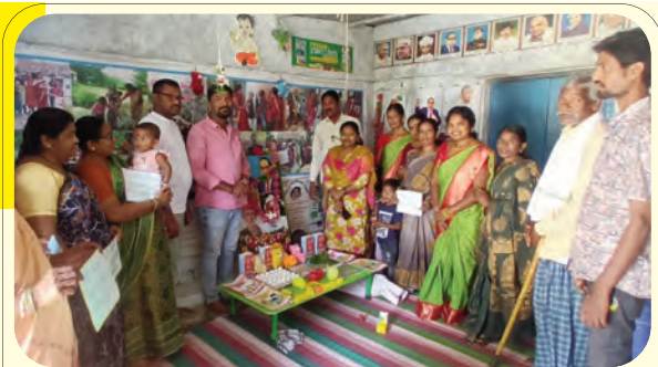
మహాత్మ జ్యోతిబాపూలే చిత్రపటానికి పూలమాలలు వేసి నివాళులు అర్పిస్తున్న దృశ్యం