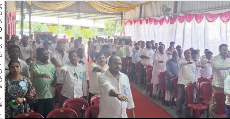
నిషేధిత మందులు అమ్మేద్దని ప్రతిజ్ఞ చేస్తున్న ఫార్మాసిస్టులు