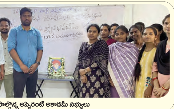
పాల్గొన్న అస్పిరెంట్ అకాడమీ సభ్యులు