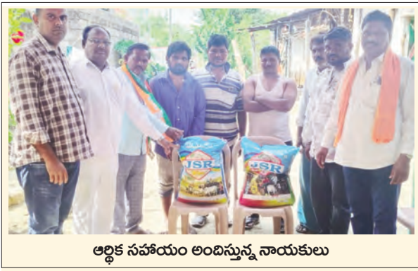
ఆర్థిక సహాయం అందిస్తున్న నాయకులు