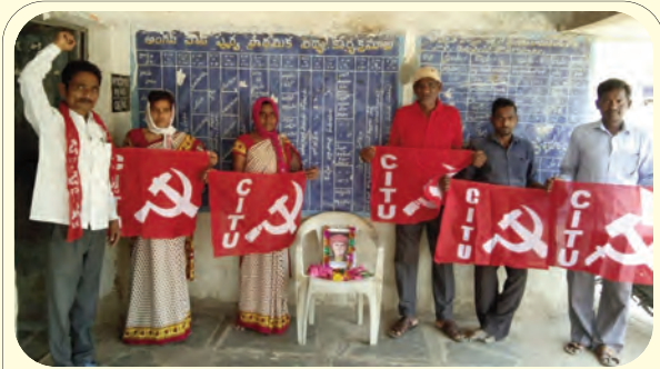
సివిటియూ ఆధ్వర్యంలో జ్యోతిబాపూలే జయంతి వేడుకలు నిర్వహిస్తున్న దృశ్యం